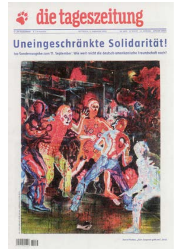
taz, Titelseite vom 11. September 2002

Es ist bemerkenswert, mit welcher akuten Wucht Richters Bild noch heute wirkt. Zur Zeit seiner Entstehung vor über zwanzig Jahren befand sich die westliche Welt in einer Phase relativer Stabilität und wirtschaftlichen Wohlstands. Die Weltkriege lagen als historische Zäsuren weit zurück, und der Eintritt ins neue Jahrtausend war vielerorts mit Fortschritts- und Aufbruchserwartungen verbunden. Heute, mehr als zwei Jahrzehnte später, erscheinen diese Gewissheiten erschüttert. Kriege, Pandemien, wirtschaftliche Krisen und der Klimawandel haben unsere Zukunftserwartungen nachhaltig verändert. Diese Aktualität unterstreicht die Wirkung des Werks über einen rein zeitgeschichtlichen Kommentar hinaus: Richter verdichtet seine Bildsprache zu einer eindringlichen visuellen Form, die auch unabhängig von ihrem Entstehungskontext ihre Gültigkeit behält.