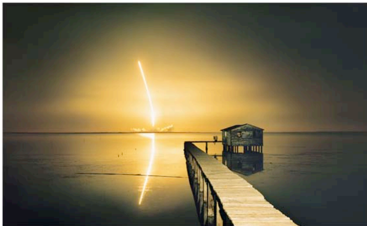
Ulf Merbold, Titusville, Florida, USA, 1997