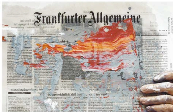
Gerhard Richter, Köln, Deutschland, 2001, ©Alfred Seiland / F.A.Z. / Courtesy Galerie Kicken, Berlin