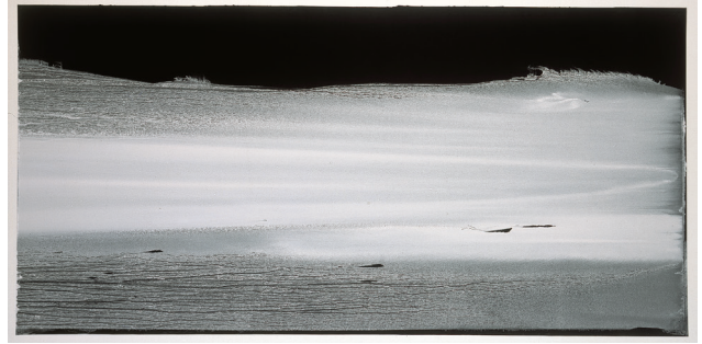
Kinor. 2008. Gouache auf Papier. 75 x 153 cm