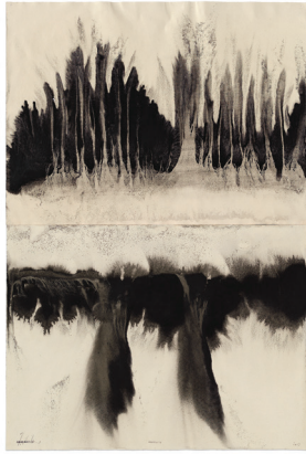
Spiegelung. 2012. Gouache auf Papier. 95 x 70 cm